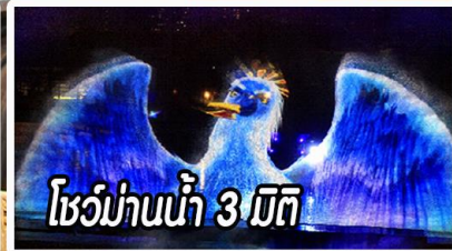
โชว์ม่านน้ำ 3 มิติ