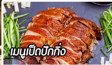
เมนูเป็ดปักกิ่ง